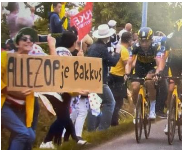
Dit is de goden verzoeken natuurlijk