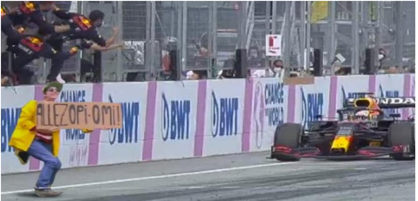
Ze dook zondag zelfs op in Stiermarken.....