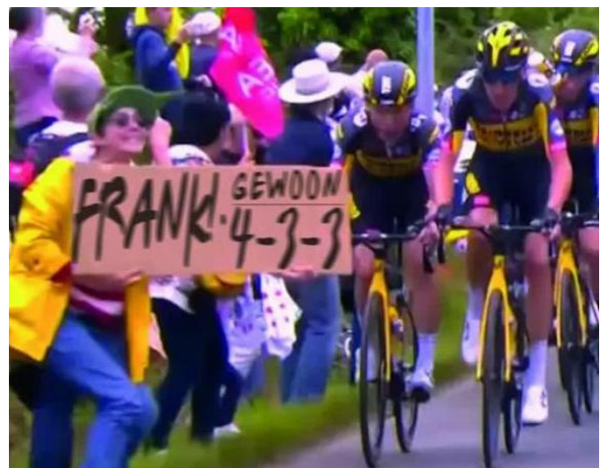
Of zou ze toch een Nederlandse zijn geweest?